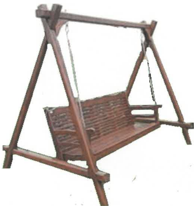
Rys. 1. Rysunek huśtawki