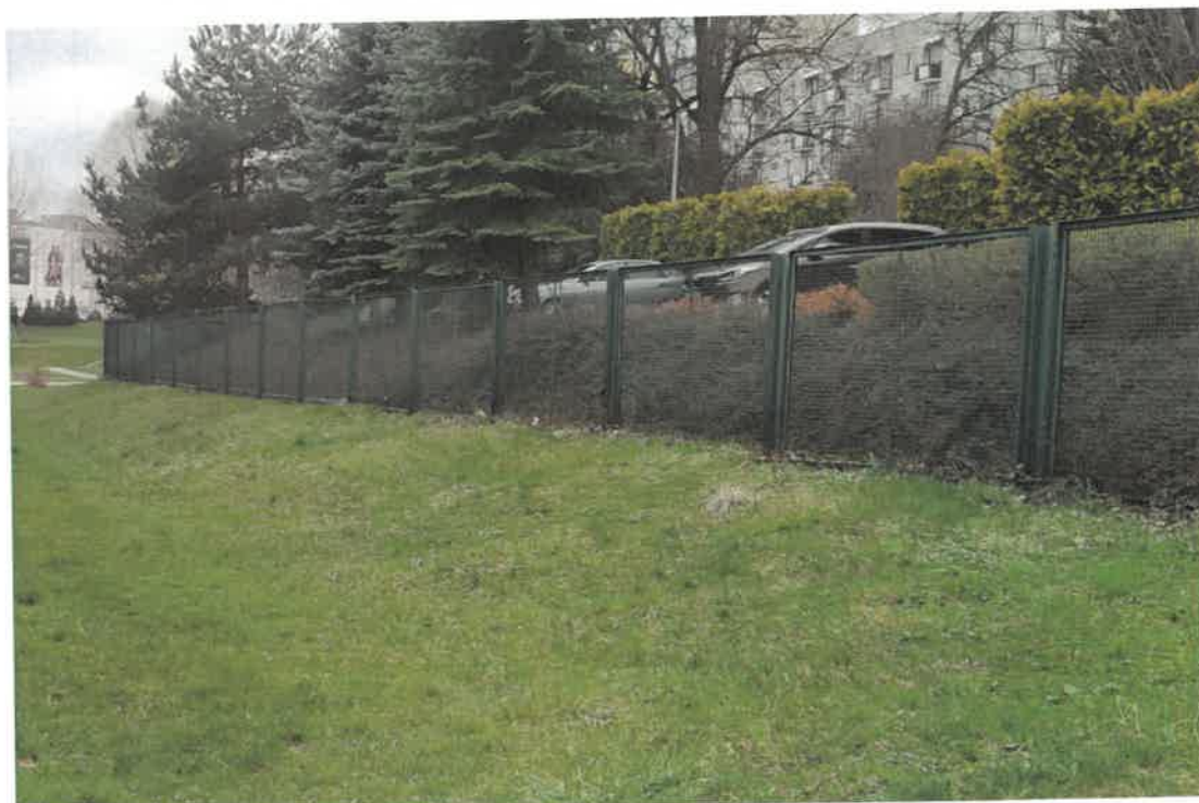
Rys. 2. istniejące ogrodzenie